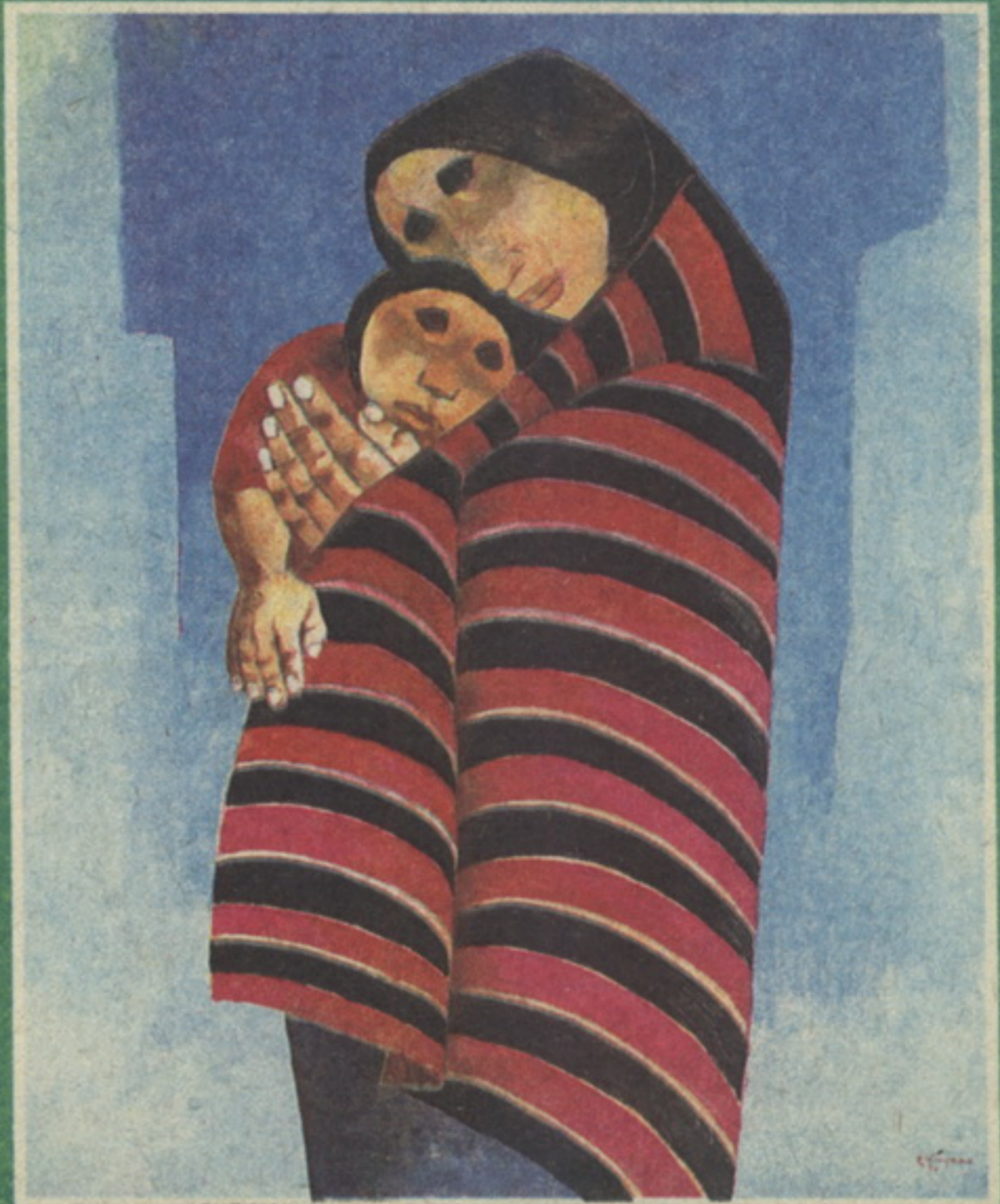
Двое, которые любят друг друга